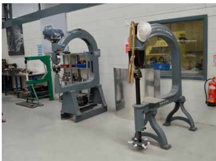
Wheeling machines og andre værktøjer vidner om håndværk i højsædet