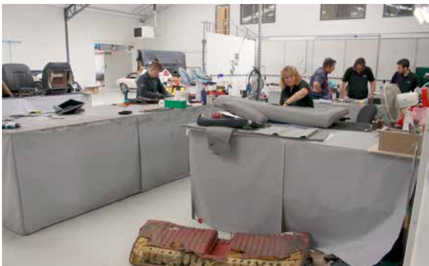
Trim produceres helt fra bunden in-house hos Classic Motor Cars

Besøget hos CMC gav os et indblik i en virksomhed, som har specialiseret sig i en sådan