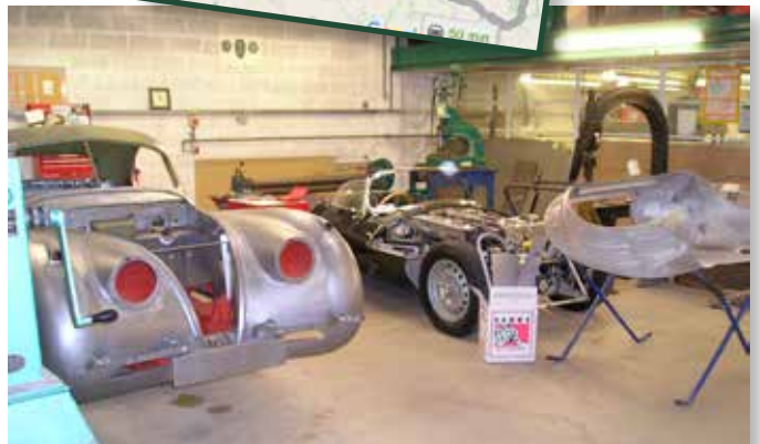
I 2009 stod bilerne tættere i CMCs værkstedsbygning, end de gør i dag.