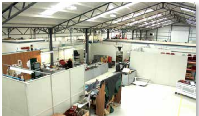
Nye lyse værkstedshaller sikrer arbejdsmiljø og kvalitet i arbejdet.