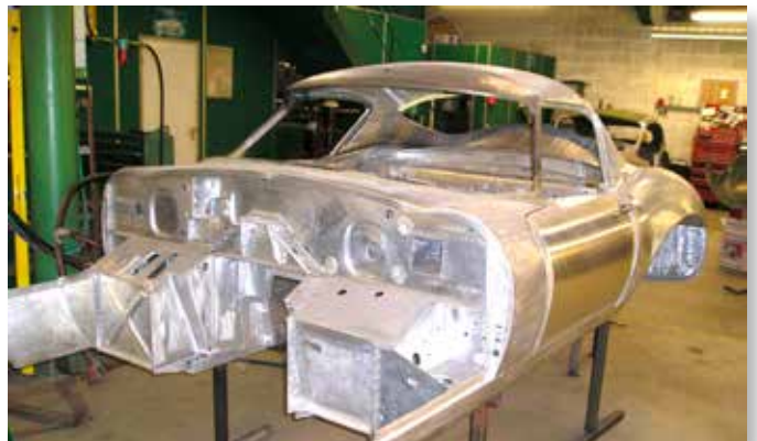
Her var den navnkundige "Lindner" E-type under restaurering i 2009