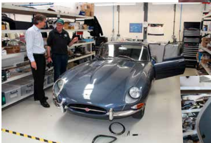
En helt særlig E-type med chassis serienummer 5