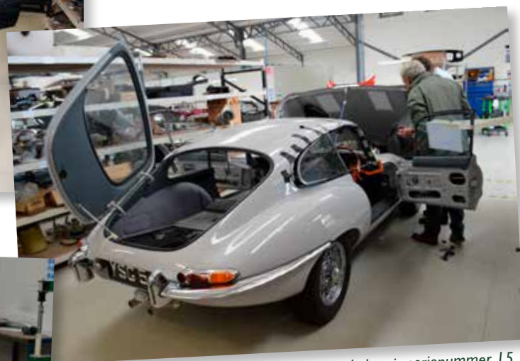
...og lige ved siden af står E-type med chassis serienummer 15