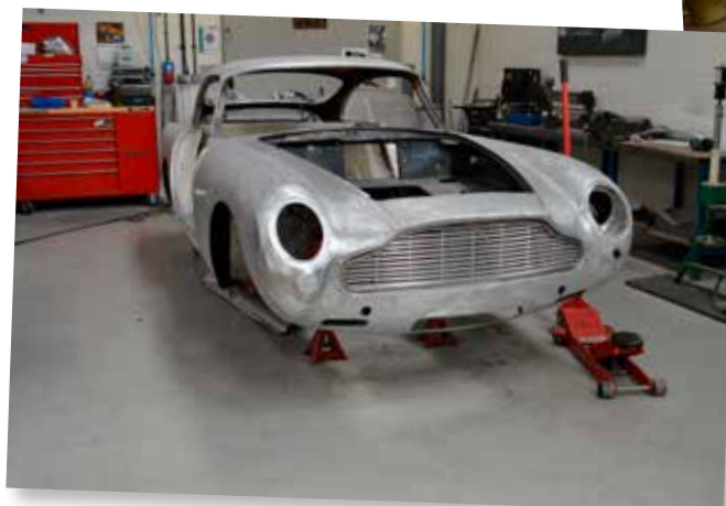
Aston Martin totalrestaurering for en kunde i Schweiz