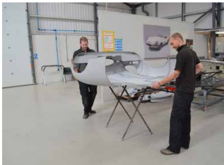
Håndværksmæssig kvalitet, præcision og orden præger CMC