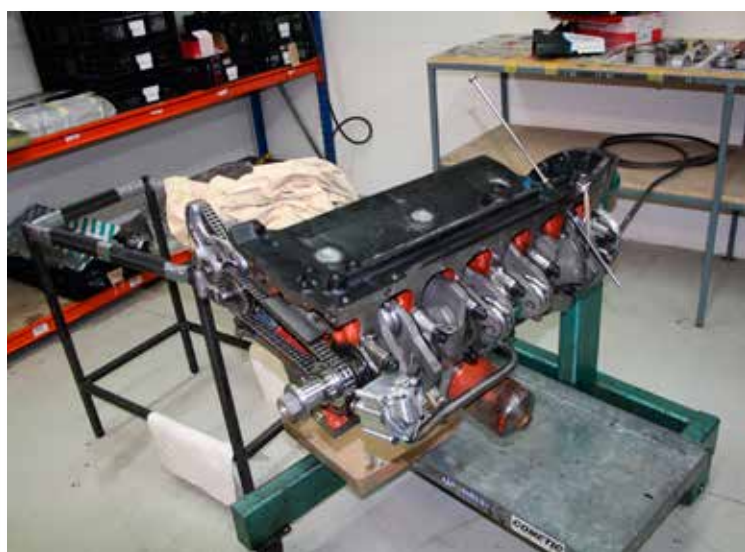
Motorreparationer og -renoveringer foretages in-house hos Classic Motor Cars