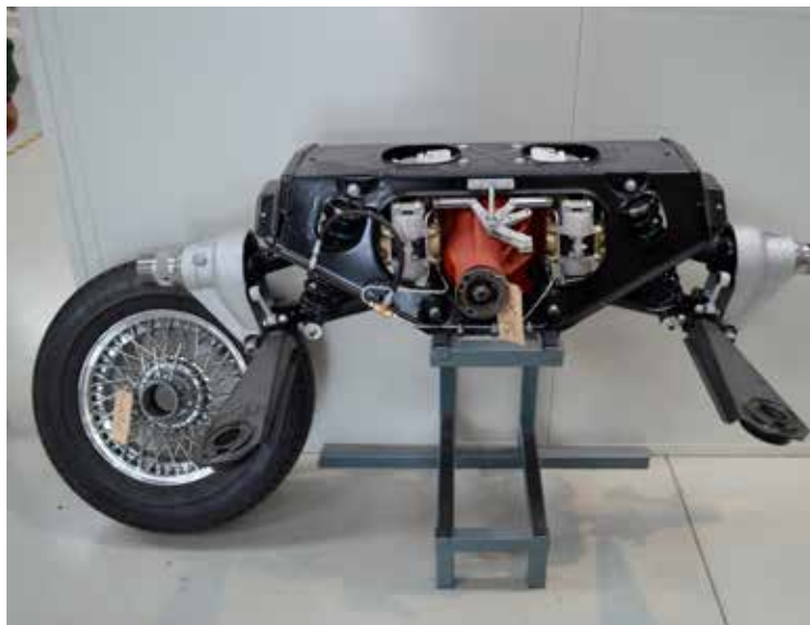
Færdigrestaureret bagtøj klar til montering.

De samme egenskaber gælder egentlig også i CMCs eget polsterværksted. Her udfører man trimarbejder til mindste detalje, og alt bliver skåret og syet fra grunden. Ofte bruges det gamle trim til måltagning for skabelse af det nye interiør.