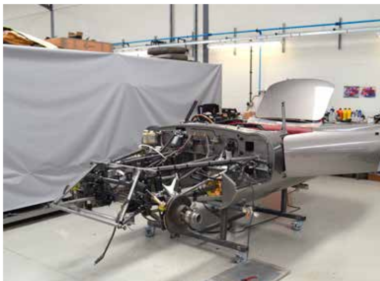
En E-type restaurering helt fra grunden er her nået til moteringsafdelingen