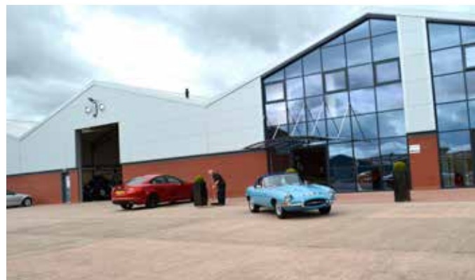
Plads, plads! Masser af plads kendetegner det nye CMC domicil

Vel inde på industriområdet svinger vi så ind på en kæmpe plads foran CMCs nye bygninger. Udenfor var pladsmanden i gang med at feje foran hoveddøren og indgangen til CMCs showroom. Vi parkerede og hilste på pladsmanden, som viste os vej til hoveddøren og showromet. Allerede ved mit besøg os CMC i 2009 syntes jeg, at deres værksted så særdeles velordnet og præsentabelt ud, men det skulle vise sig, at de nye faciliteter til sammenligning nu var langt større og om muligt endnu mere ordnede. Det første, som mødte os, var CMCs nye showroom, hvor bilglade drenge som vi må gå med hagesmæk for ikke at glide på de blankpolerede marmorfliser.